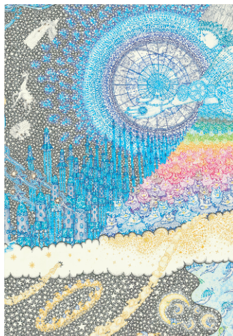
DONA 「Rainbow heart 1」