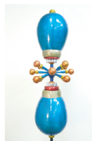
服部美樹 「microphone for presentation II」